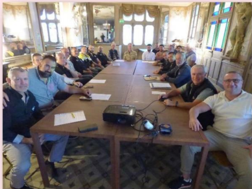
Une assemblée générale très suivie par l'ensemble des joueurs

La saison 2023-2024 du club de rugby A Visto de Naz à peine finie que se profilent déjà les nombreux projets pour 2025.