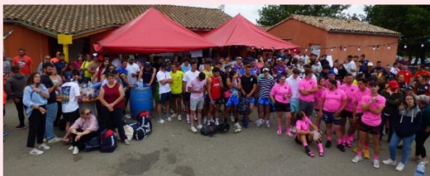
Grosse affluence pour le 7 ème tournoi de Touch'Rugby

Une septième édition qui fut couronnée de succès avec la présence, le vendredi, des écoles de rugby de Trèbes, Conques et Carcassonne. Le samedi, lors du grand tournoi, 20 équipes issues de tout le département mais aussi de l'Hérault et des Alpes-Maritimes étaient réparties sur quatre challenges : Jeune, Mixte, Féminine et Vétérain.