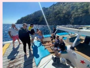
Un moment de détente mérité avant l'organisation du tournoi